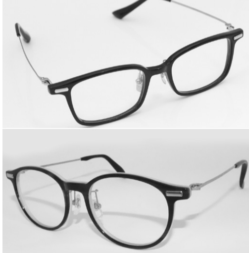
「カラーズコレクション」メンズモデル(上)とレディースモデル

提案・提供してくれる「技術力がある眼鏡小売店」に対し、ITの力を持つて貢献したいと考えている。当社のブリスにお立ち寄りいただき、ご相談をいただきたい」としている。 【問い合わせ先】（株）ユーエスエス 電話03・6402・5321